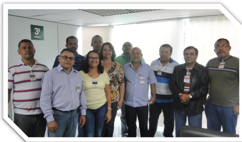
GT Racionalização (Representante do SINASEFEe Fasubra)

O SINASEFE participou da primeira reunião do ano de 2013 do Grupo de Trabalho para Racionalização de Cargos no PCCTAE e sobre a Terceirização nos IFs no último dia 29.